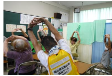
集いの場(ふれあいサロン活動)