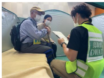
アセスメント(巡回訪問調査)